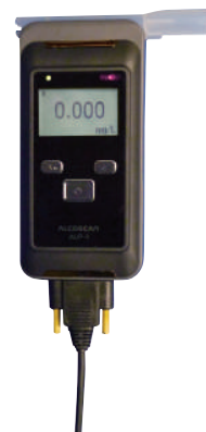
AC-015iv AC-015mm AC-015SYS

デジタルタコグラフ (トランストロン社製：DTSシリーズ) (いすゞ社製：MIMAMORI) (システック社製：ロジこんぱす)